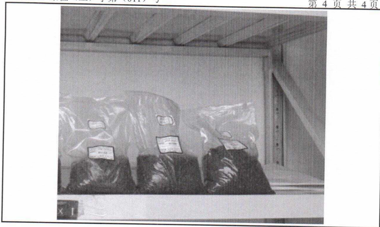
图 1 固体废物样品