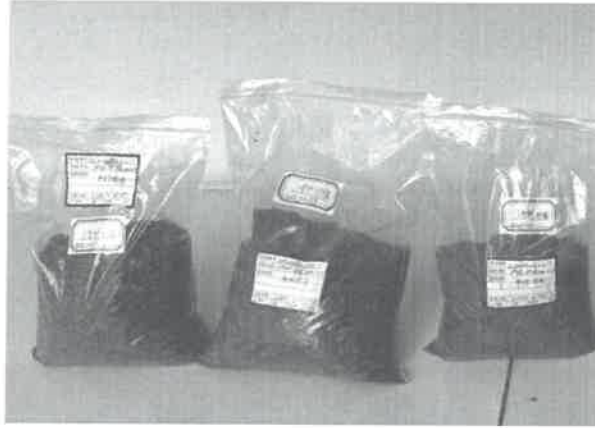
附图 1 自送样品